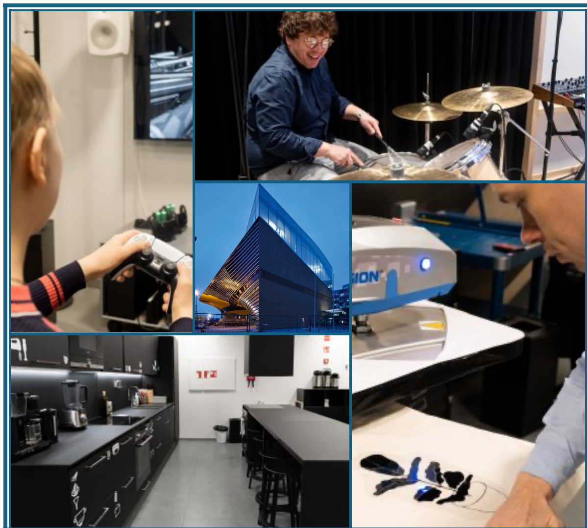
Bepillantás az Oodiba

Csütörtökön jobb idő lett, így végre szabadtéri lehetőségeket is kipróbálhattunk. Helsinkéhez sok kis sziget tartozik, és mi egy Mustikkamaa (finnül: áfonya föld) nevű helyre mentünk. Itt is rengeteg új fajta feladattípust tanultunk, egyrészt a környezetünk megismerésével kapcsolatban, másrészt arról, hogyan lehet bevinni bizonyos tantárgyakat egy ennyire a modern világtól mentes környezetbe. Voltaképpen ezek a feladatok elvégezhető lennének akár az iskolában is, viszont a lényeg a digitális detoxikációban, a természethez való visszatérésben rejlik. Azt is átbeszéltük, hogyan érdemes egy ilyen alkalomra felkészülni, és milyen eszközök kellene magához a foglalkozás megtartásához. Zárásként néhány a mindfulnesshez kötődő gyakorlatot is megnéztük, így amellet, hogy élvezhető formát adtunk a tanulásnak, még a stresszkezelést és önismeretet is fejlesztettük egy kicsit.