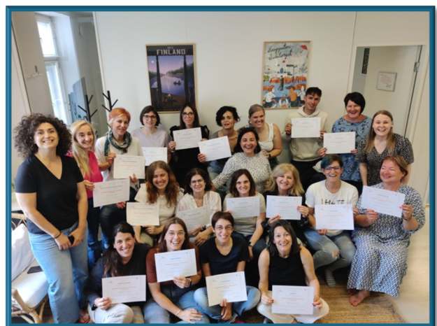
A képzést elvégeztük!

A pénteki napon megismertünk egy Goosechase nevű applikációt is, amivel érdekes csoportos feladatokat lehet koordinálni. Egyben ez volt az utolsó nap is, ami már a kurzus zárásáról szólt. Én úgy gondolom, hogy rengeteg hasznos dolgot tanultunk, és nemzetközi kapcsolatokra is szert tettünk, ami bármikor jól jöhet még a jövőben. Remélem lesz még alkalmam ilyen élményben, hiszen a szakmai fejlődés mellett lehetőségem nyílt minden irányban fejlődni.