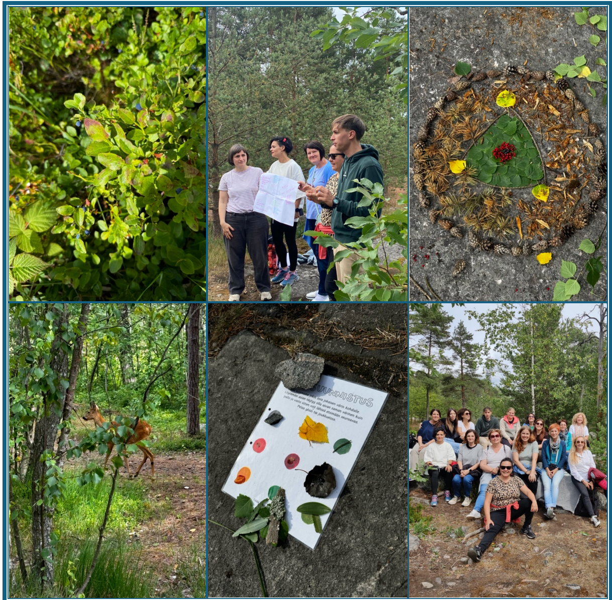
Foglalkozások a természetben

A pénteki napon megismertünk egy Goosechase nevű applikációt is, amivel érdekes csoportos feladatokat lehet koordinálni. Egyben ez volt az utolsó nap is, ami már a kurzus zárásáról szólt. Én úgy gondolom, hogy rengeteg hasznos dolgot tanultunk, és nemzetközi kapcsolatokra is szert tettünk, ami bármikor jól jöhet még a jövőben. Remélem lesz még alkalmam ilyen élményben, hiszen a szakmai fejlődés mellett lehetőségem nyílt minden irányban fejlődni.