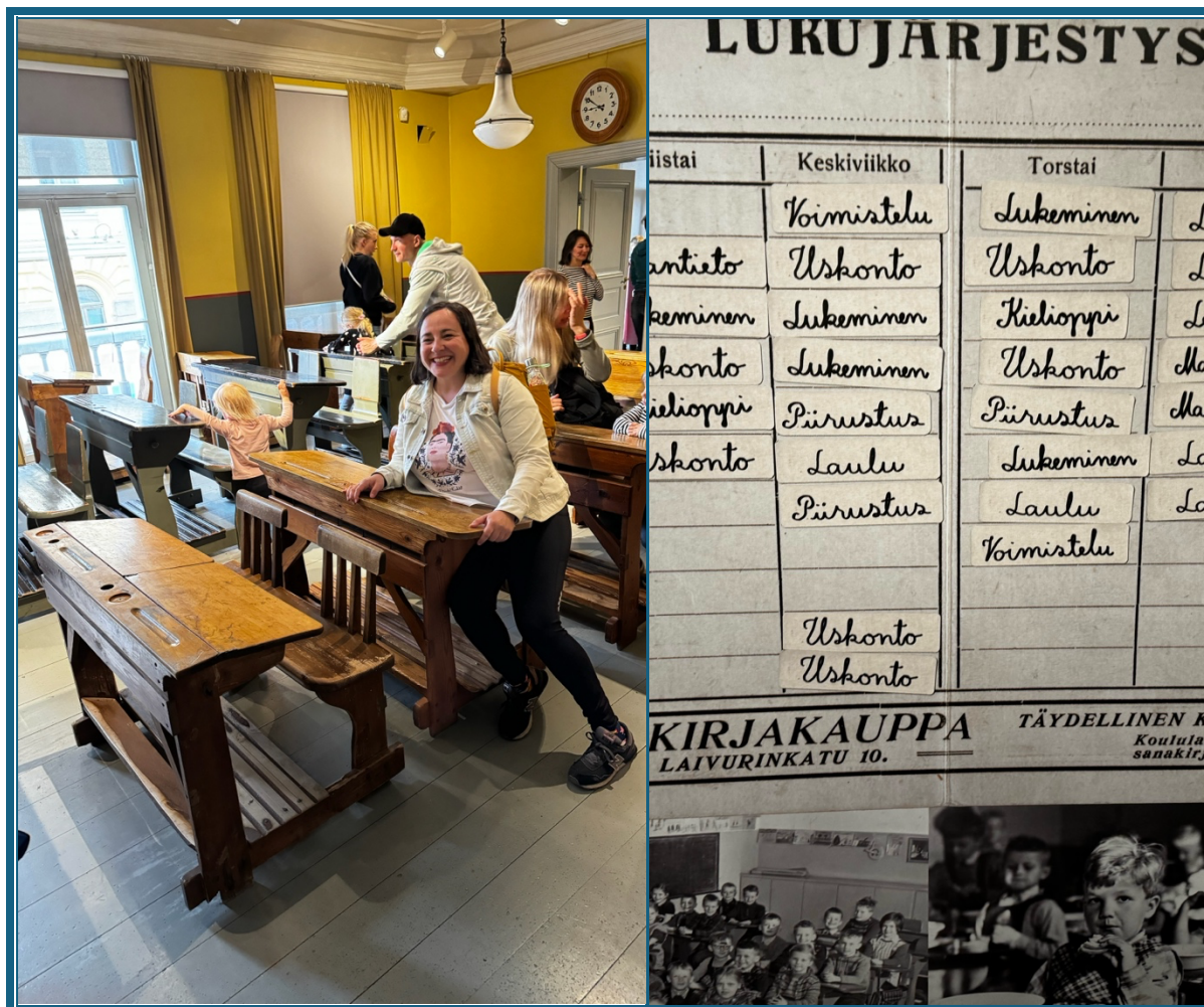
A Helsinki Múzeumban

Szerdán az Oodi nevű helsinki központi könyvtárba látogattunk el, ami ennél valójában sokkal több funkciót lát el. Egy hatalmas, 3 emeletes komplexumról van szó, melynek legalsó szintjén kiállítások és mozi működik. Ugyanitt található egy kávézó, és egy ingyenesen igénybevehető hatalmas közösségi tér asztalokkal, és társasjátékokkal. A második emelet a kreatív ötletek megvalósításáért van – bárki által ingyen használható varrógépek, nyomtatók, speciális bőrvágó gépek (és még hosszan lehetne sorolni az eszközök listáját) található itt. Még konzolszoba, zenei próbaterem és informatikai munkaállomás is helyet kapott itt, és habár ezek is ingyenesek , előzetes regisztrációhoz kötöttek. A harmadik szinten maga a könyvtár található, ahol szintén kávézó és munkaállomások várják az embert. Mivel esett az eső, egész szerdán beltérbe kényszerültünk, és az Oodi remek helyt adott az tantermen kívüli programok kipróbálásának. Különböző játékos feladatokat próbáltunk ki, ami ezt a közösségi teret helyezi középpontba, és a nap végén csoportokba állva kitaláltunk egy programot, amit a saját osztályunkkal valósítanánk meg ezen a remekül felszerelt és elérhető helyen. Voltak kulturális feladataink, könyveket, festményeket kellett megtalálnunk, de volt olyan is, ahol az volt a feladat, hogy tudjuk meg szabad-e egy adott dolgot az Oodiban csinálni.